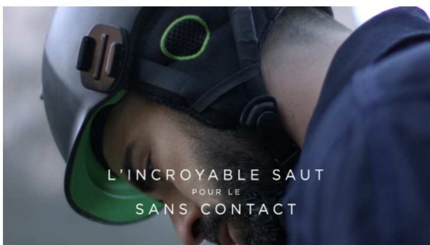
Campagne de communication «L'incroyable saut pour le sans contact» qui a reçu le prix de la meilleure campagne de pub 2018

Ces campagnes, qui ont totalisé près de 20 millions de vues sur les réseaux sociaux, ont été plébiscitées par la profession avec le prix de la « meilleure campagne de pub de l'année 2018 » (Trophée de la communication), et contribuent à la redynamisation de la marque CB via un positionnement jeune et décalé.