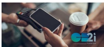
Le paiement digital mobile NFC