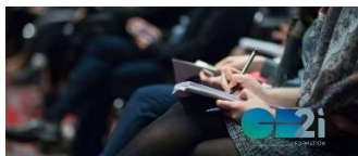
La monétique et le système CB

Découvrez ci-dessous l'éventail de formations, dispensées en présentiel ou en distanciel. Pour un descriptif complet voir notre site web www.cartes-bancaires.com