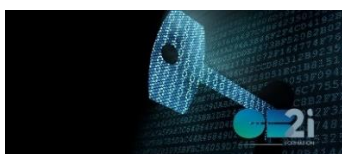
Introduction à la cryptographie monétique