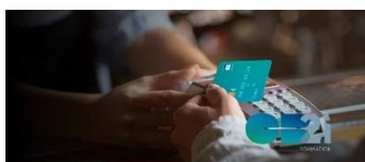
La lutte contre la fraude à la carte bancaire