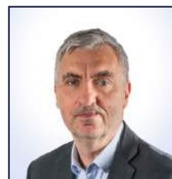
Loÿs Moulin Projets & Marketing