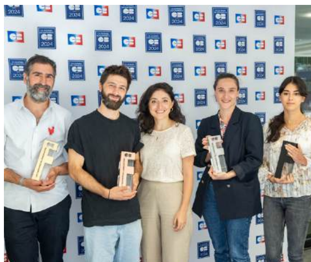
Ziqy, Smartback, Commerso, et Handsome Trophées de l'Innovation CB #2024