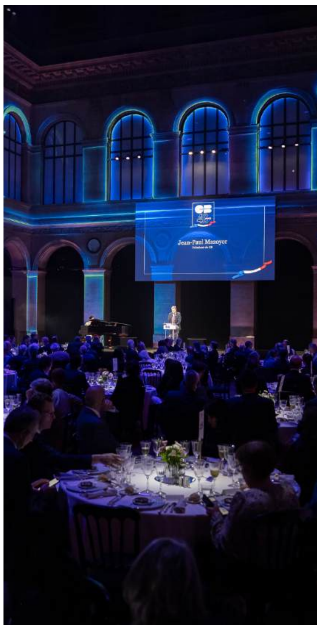
40 ans CB, au Palais Brongniart