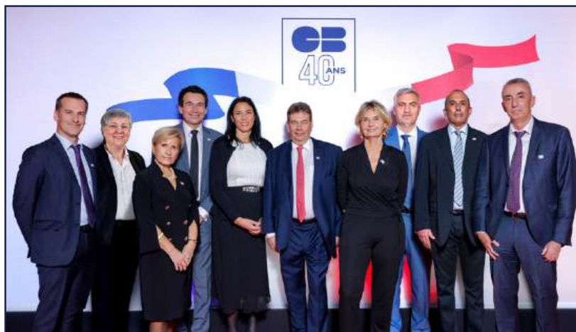
Équipe de Direction