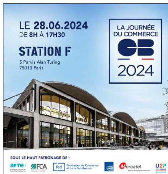
Invitation "La Journée du Commerce CB"

Enfin, en 2024, CB a noué un partenariat avec la Fédération Française de Cyclisme pour soutenir l'Équipe de France de Cyclisme. Ce partenariat complète et élargit celui signé avec l'équipe de Cyclisme Féminin FDJ-Suez en 2023, tous deux reflétant l'engagement de CB envers les valeurs d'inclusion sociale et territoriale, de dépassement de soi et d'attachement au respect de la diversité et à l'ancrage local et national que représente le cyclisme.