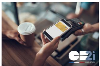
Le paiement digital mobile NFC