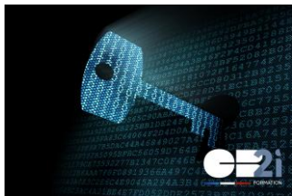
Introduction à la cryptographie monétique

Découvrez, ci-dessous, l'éventail de formations dispensées en présentiel ou en distanciel. Pour un descriptif complet, voir notre site web www.cartes-bancaires.com