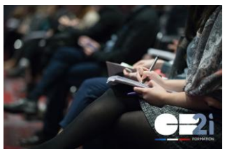
La monétique et le système CB