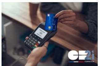
La lutte contre la fraude à la carte bancaire