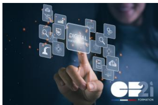
Sensibilisation à la sécurité de l'information chez CB