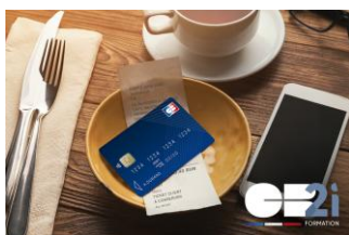
Spécial commerce : les paiements par carte et mobile