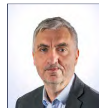
Loÿs Moulin Projets & Marketing