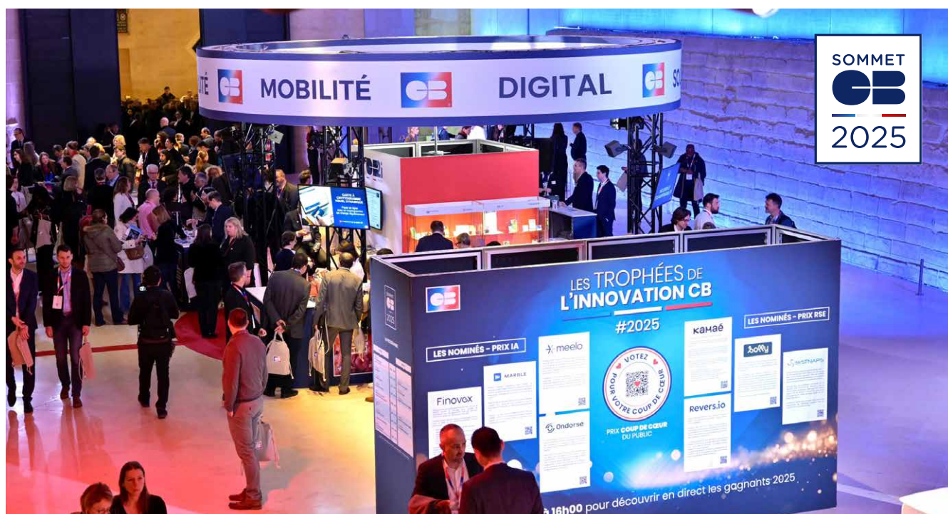
Sommet CB 2025

En 2025, l'offre digitale CB a également poursuivi son développement en ligne avec les objectifs du plan stratégique CB 2026. Les paiements mobiles se sont révélés un véritable levier de croissance des flux CB, en particulier via le déploiement à grande échelle de l'offre CB désormais cobadgée sur Apple Pay par la majorité des membres.