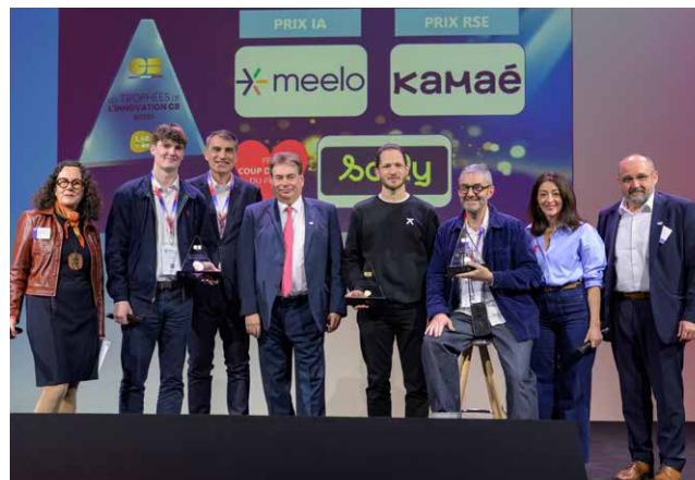
Trophées de l'Innovation CB 2025