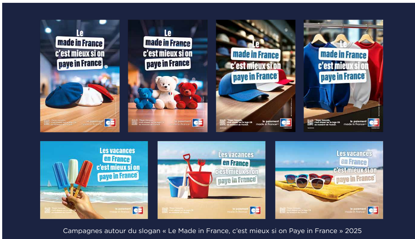
Campagnes autour du slogan « Le Made in France, c'est mieux si on Paye in France » 2025

À travers ces différentes initiatives, CB renforce sa visibilité et son positionnement d'acteur central du paysage des paiements, capable de fédérer les acteurs économiques et institutionnels autour des enjeux stratégiques du secteur.